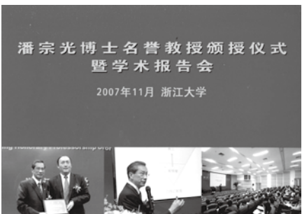
· 二〇〇七年，獲浙江大學楊衛校長頒授名譽教授。