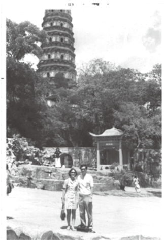
· 一九七三年，與太太在浙江杭州留影。

我不由得要回憶起六十年代在英國留學時期被外國人嘲笑自己國家貧窮落後的情境，多年來這恥辱一直銘記於心，更化成對祖國命運的強烈祝願。古人說：「子不嫌母醜」，我衷心希望文革能儘早結束，國家能夠真正正地發展經濟與軍事力量，及提升人民質素，這樣中國的老百姓才能慢慢抬起頭來。我相信一旦國家改革開放，定能進入與世界競爭的軌道。