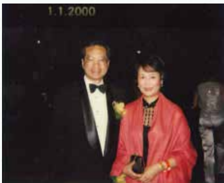
·我和太太在千禧年一月一日晚合照。