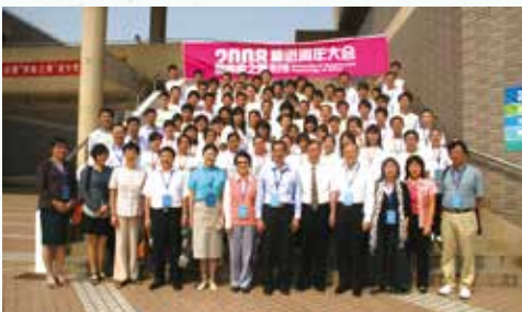
• 二〇〇八年精進愛心社夏令營，一眾社員大合照。（前排左六：太太，左七：我，左八：中國科學技術大學朱清時校長）