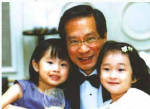
• 二〇〇五年，在慶祝結婚四十周年時，跟兩位孫女合照。

然，修行對於我還只是開始。我從事精進基金便是要將自己投入對於國家、社會更有貢獻的地方，從中獲得的快樂亦難以言喻。