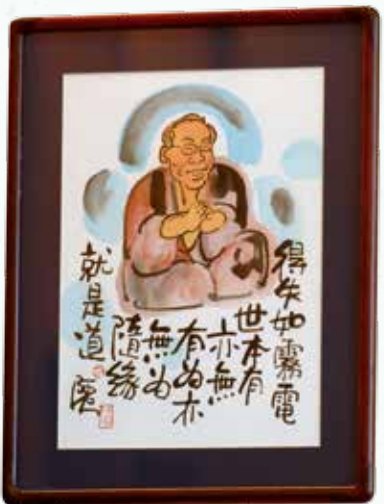
· 著名畫家阿虫爲我畫的一幅畫。

到了一定的年齡，隨着對人生的看化，對物質的要求更是簡單。我愈來愈體會到《道德經》的境界，所謂「心死神活」，這就是「人心死而道心生」的道理，亦即是「恬淡虛無，清心寡慾，道自來歸」。