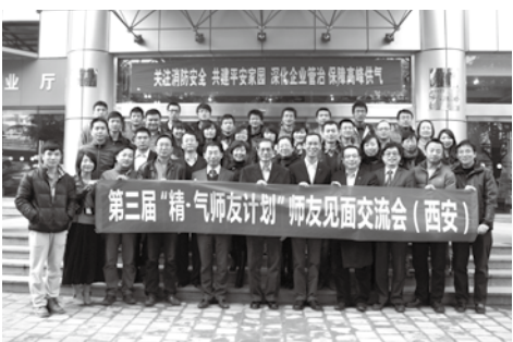
· 基金於二〇一〇年開始，開設「精·氣師友計劃」，是理大導師計劃的延伸。（前排左六：我）