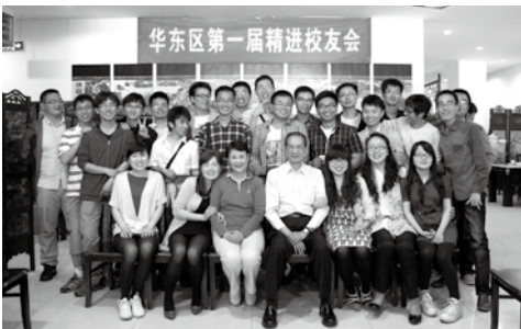
二〇一三年五月，我（前排左四）與太太（前排左三）到杭州與畢業生會面，促成了華東區第一屆精進校友會的成立。

經常收到同學們或畢業生們的來信，行文中可見基金教曉了他們一些做人道理，這是讓我們倍感安慰的事。