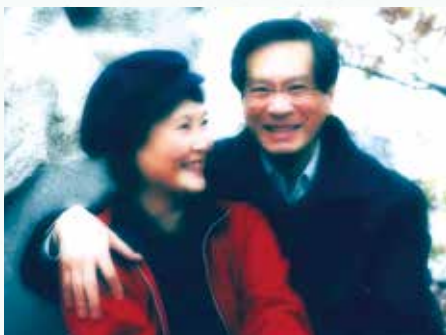
·我很感恩，人生路上有太太與我並肩同行。