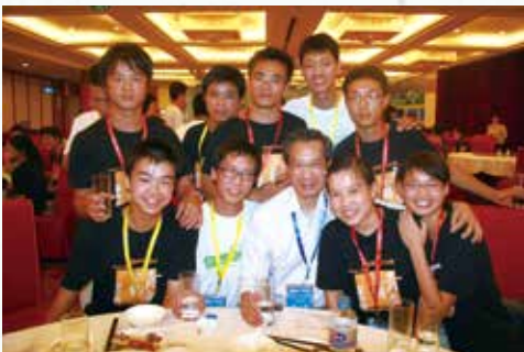
• 二〇〇八年精進愛心社夏令營，我與一些社員大合照。