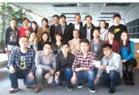
二〇一三年初，到深圳與畢業同學會面。 （第二排左四：我）

吉首市，招收的多是來自少數民族農村家庭，精進基金選擇吉首大學也是別具意義的，它的學生大多畢業後都願意留在當地，幫助貧困地區發展。