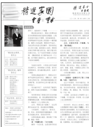
《精進家園》是一個傳遞「精進」精神的平台。

分會，我亦會前往每個分會與學生見面，為分會的建設及發展提供建議。我鼓勵他們在每一分會開設一個特別戶口，每人根據自己的能力與意願，每月捐十元、五十元或一百元不等到這個戶口。主要目的是將感恩的心變為一種行動，養成捐款助人的習慣。目前，我們在北京、廣東、上海、杭州及西安設立校友會，集結力量，為社會服務。